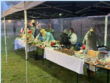
Zaměstnanci Obce Vlasatice